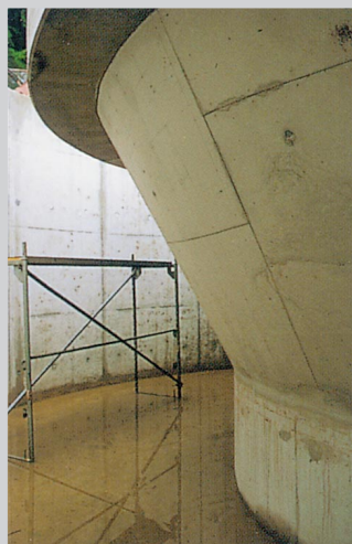
◀ Fertiges Trichterelement ohne Schalhaut