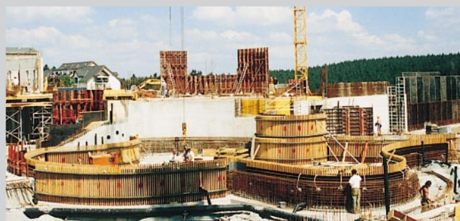
Freibad-Beckenwände. Geschalt mit WEHA®-Gliedergurt