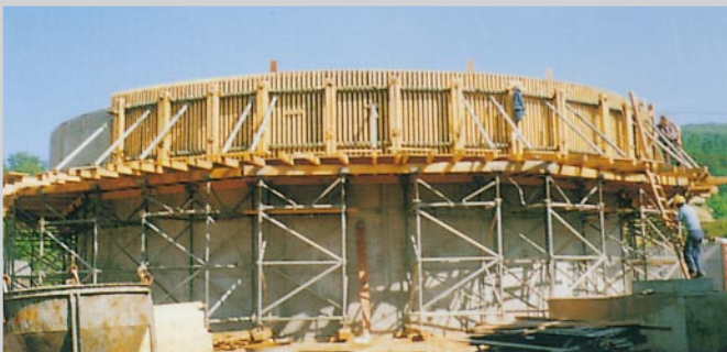
Rinnenabstellung bei Kläranlagen